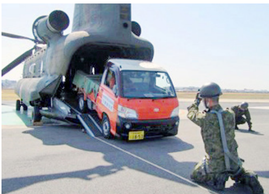
陸上自衛隊中部方面隊とのヘリ輸送訓練