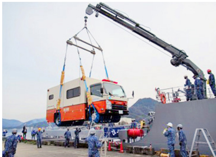
海上自衛隊舞鶴地方総監部との海上輸送訓練

具体的には、自治体や指定公共機関などの防災訓練へ積極的に参加するほか、自衛隊や海上保安庁と災害時における連携体制の構築に基づく合同訓練を実施いたしました。