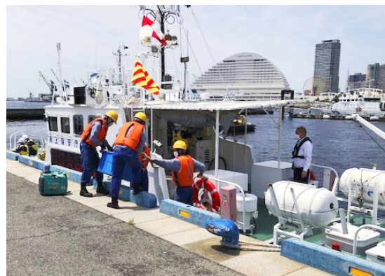
第五管区海上保安本部との海上輸送訓練