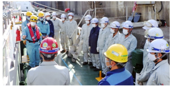
協力会社等との“相方向”コミュニケーション

従業員があらゆる場面を通じて、設備の建設・保全作業の現場に足を運び、協力会社等とのコミュニケーション機会を積極的に創出、充実させていくことを通じて相互理解を深め、ともに安全活動を推進していくことを目的とした“相方向”コミュニケーションを積極的に展開し、安全意識の高揚、災害発生リスクの低減を図っています。