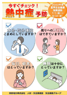
安全“考動”を促すポスター

発生件数の多い「足元」に起因する災害に焦点を当て、工事稼働が増加する5月に実施し、災害の未然防止を図る