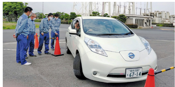
車両安全運転の徹底

車両を運転する従業員に対しては、社会一般よりも一段高い安全運転レベルをめざし、当社グループ独自の「車両運転者認定制度」を設けています。安全運転に関する教育や実技訓練を経て、車両運転者認定証を付与するとともに、定期的に教育・訓練を繰り返すことで、安全運転の徹底を図っています。