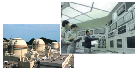
発電所見学・シミュレーター体験