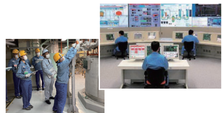
安全・安定運転に向けた取組み