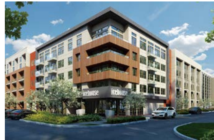
テキサス州 ダラス市