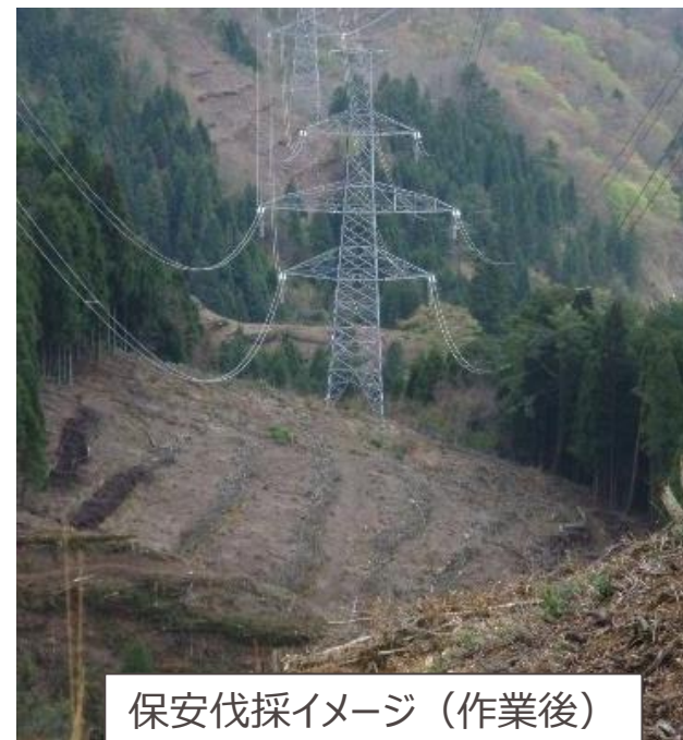
保安伐採イメージ（作業後）