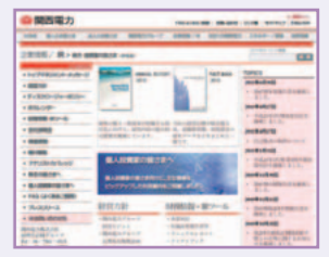
「企業情報/IR」(当社HPサイト：随時更新)

Web 「株主・投資家のみなさま(IR情報)」 http://www.kepco.co.jp/ir/index.html