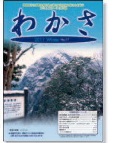
原子力職場の一体感を醸成する「わかさ」(季刊)

一方、原子力部門の従業員と協力会社で働く方々を対象としたコミュニケーション誌『わかさ』を定期的に発行しています。原子力に関するトピックスなどを共有し、社内にも安全最優先の意識を浸透させるとともに、協力会社で働く方々も含めた一体感の醸成や活力ある原子力職場づくりをめざしています。