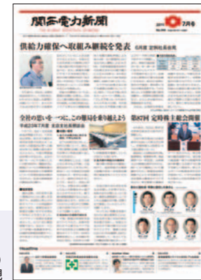
「関西電力新聞」(毎月1回発行)で適時的確な情報発信を実現

また、こうした情報に対して従業員から寄せられた声を、経営層に直接伝えることにより、双方向のコミュニケーションを実践しています。