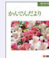
「かんでんだより」(株主さま向けの事業報告書：年2回発行)