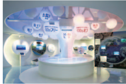
堺港発電所PR施設 「エルクールさかいこう」 ※ご見学にはご予約が必要です。