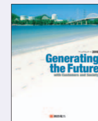
「アニュアルレポート」(株主・投資家のみなさまや取引先に向けて経営内容の総合的な情報を掲載：年1回発行)

株主・投資家のみなさまに対して、当社事業の概要や、経営目標、財務データなどを提供しています。