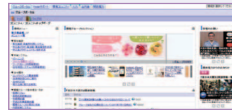
グループポータルサイトで情報をタイムリーに発信

一方、原子力部門の従業員と協力会社で働く方々を対象としたコミュニケーション誌『わかさ』を定期的に発行しています。原子力に関するトピックスなどを共有し、社内にも安全最優先の意識を浸透させるとともに、協力会社で働く方々も含めた一体感の醸成や活力ある原子力職場づくりをめざしています。