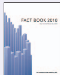
「ファクトブック」(経営目標や販売電力量、設備投資額、財務諸表の経年データなどを掲載：年1回発行)