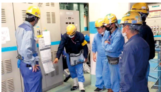
協力会社等との“相方向”コミュニケーション

従業員があらゆる場面を通じて、設備の建設・保全作業の現場に足を運び、協力会社等とのコミュニケーション機会を積極的に創出、充実させていくことを通じて相互理解を深め、ともに安全活動を推進していくことを目的とした“相方向”コミュニケーションを積極的に展開し、安全意識の高揚、災害発生リスクの低減を図っています。