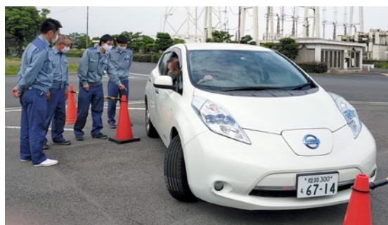
車両安全運転の徹底

車両を運転する従業員に対しては、社会一般よりも一段高い安全運転レベルをめざし、当社グループ独自の「車両運転者認定制度」を設けています。安全運転に関する教育や実技訓練を経て、車両運転者認定証を付与するとともに、定期的に教育・訓練を繰り返すことで、安全運転の徹底を図っています。