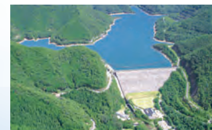
●奥多々良木発電所の多々良木ダム

揚水発電は、余裕のある夜間の電気を使用して上部ダムに水を汲み上げ、電気が多く使われる昼間にその水を利用して発電します。この発電方式は、刻々と変化する電力需要にあわせて柔軟に対応することができます。さらに、奥多々良木発電所1号機、2号機では、深夜の電力需要の変動に対応して水を汲み上げるために使用する電力の調整ができる可变速揚水発電システムへ改修する工事をすすめています。これにより夜間および翌日のきめ細かな需給制御が可能となり、今まで以上に安定した電力供給をめざします。