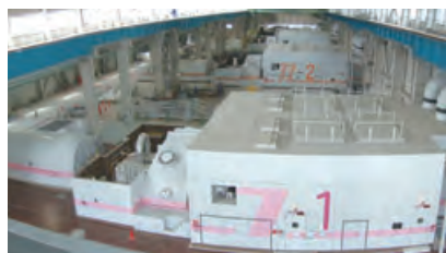
●コンバインドサイクル発電設備(堺港発電所)

火力発電は、運転台数の増減や出力調整をすることで、電力需要の変動に合わせて柔軟に対応できる電源です。この長所を活かして、太陽光発電や風力発電など気象状況の影響を受けやすく、電気の消費量と発電量のバランス維持がむずかしい新エネルギーのバックアップ電源としても期待されています。今後も電力需要の大幅な変動に、火力発電が柔軟に対応します。