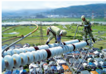
●送電線のメンテナンス

お客さまに電気を安定してお届けする。そのために関西電力では社員一人ひとりが、一貫した流れの中で仕事に取り組んでいます。長期的な視野で燃料を調達し、効率的に電気をつくること。その電気を無駄なくお客さまにお届けすること。安全を最優先にそれぞれの責任を果たし、電気の安定供給に努めています。