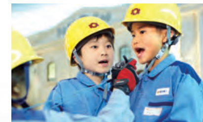
●電力会社パビリオンの一場面

2009年3月にオープンした「キッズニア甲子園」(兵庫県西宮市)は、子どもたちが憧れの仕事にチャレンジし、楽しみながら社会のしくみを学ぶことができる職業・社会体験型施設です。関西電力はここにパビリオンを出展しています。停電復旧作業の体験を通して、電気の大切さや使命感を持って仕事をやり遂げることの素晴らしさを感じてもらうことができると願っています。