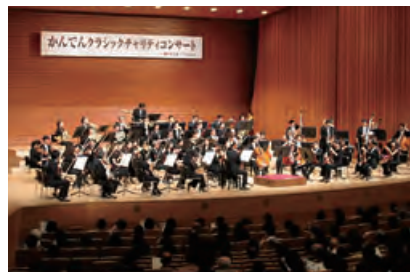
●かんでんクラシックチャリティコンサート2011(和歌山)

1988年から各地でクラシックコンサートを実施しています。チャリティ等の目的で実施しているところもあり、地域の皆さまに素晴らしい演奏をお楽しみいただいています。