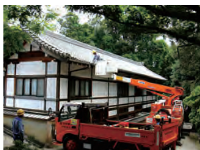
●高所作業車を使った文化財の清掃(奈良)

自治体や自治会など地域の諸団体と連携し、事業所周辺、海岸や河川、観光地や社会福祉施設などを対象に幅広く清掃活動などを行っています。