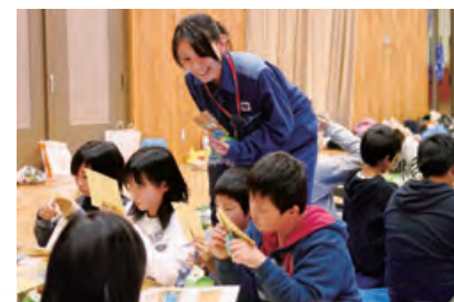
●子どもたちとエネルギーや環境について考える出前教室

未来を担う子どもたちに、エネルギーや環境について、正しく理解し、自ら考えてもらうため、関西電力の社員が地元の小・中学校などにお伺いして出前教室を実施しています。出前教室では、実験や体験を通して子どもたちに楽しく学んでもらえるように、各事業所が工夫を凝らしています。