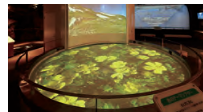
●PR施設「黒部川電気記念館」

身近に電気やエネルギーのことを知っていただくために、各地にPR施設を設置しています。