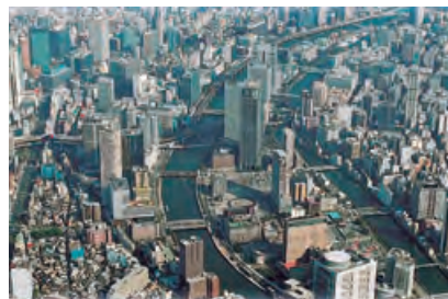
●大阪・中之島界隈

関西電力は、まちづくり提案活動やスマートコミュニティ構想等にかかる取組みを通じて、低炭素社会の実現や関西地域の活性化・成長に貢献しています。本店がある大阪・中之島では、関西電力が事務局を務める「中之島まちみらい協議会」が、ホームページによる情報発信や、地域の美化、シンポジウムの開催など、さまざまなカタチでまちづくりを推進しています。