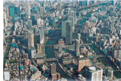
●大阪・中之島界隈

関西電力は、まちづくり提案活動やスマートコミュニティ構想等にかかる取組を通じて、低炭素社会の実現や関西地域の活性化・成長に貢献しています。本店がある大阪・中之島では、関西電力が事務局を務める「中之島まちみらい協議会」が、ホームページによる情報発信や、地域の美化、シンポジウムの開催など、さまざまなカタチでまちづくりを推進しています。