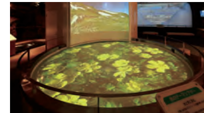
●PR施設「黒部川電気記念館」

身近に電気やエネルギーのことを知っていただくために、各地にPR施設を設置しています。