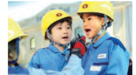
●電力会社パビリオンの一場面

2009年3月にオープンした「キッズニア甲子園」(兵庫県西宮市)は、子どもたちが憧れの仕事にチャレンジし、楽しみながら社会のしくみを学ぶことができる職業・社会体験型施設です。関西電力はここにパビリオンを出展しています。停電復旧作業の体験を通して、電気の大切さや使命感を持って仕事をやり遂げることの素晴らしさを感じてもらうことができると願っています。