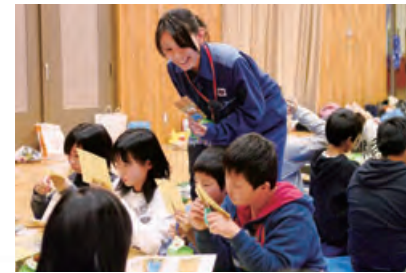
●子どもたちとエネルギーや環境について考える出前教室

未来を担う子どもたちに、エネルギーや環境について、正しく理解し、自ら考えてもらうため、関西電力の社員が地元の小・中学校などにお伺いして出前教室を実施しています。出前教室では、実験や体験を通して子どもたちに楽しく学んでもらえるように、各事業所が工夫を凝らしています。