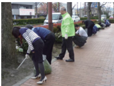
●行政と協働でおこなう清掃活動(滋賀)

自治体や自治会など地域の諸団体と連携し、事業所周辺、海岸や河川、観光地や社会福祉施設などを対象に幅広く清掃活動などをすすめています。