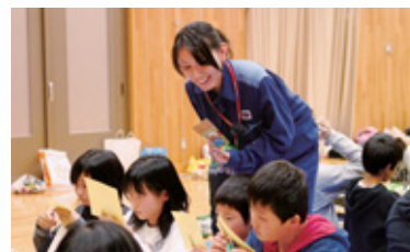
●年間1,000回を超える人気の出前教室

未来を担う子どもたちに、エネルギーや環境について、正しく理解し自ら考えてもらうため、関西電力の社員が地元の小中学校などにお伺いして出前教室を実施しています。出前教室では、実験や体験を通して学んでもらえるように各事業所が工夫を凝らしており、2009年度は約1,200回を実施し、約5万1,000人の子どもたちと一緒にエネルギーや環境について考えました。