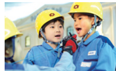
●電力会社パビリオンの一場面

2009年3月にオープンした「キッズニア甲子園」(兵庫県西宮市)は、子どもたちが好きな仕事を体験するなかで、社会のしくみを学ぶことができる職業・社会体験型施設です。関西電力はここにパビリオンを出展。停電復旧作業の体験を通して、電気の大切さや使命感を持って仕事をやり遂げることの素晴らしさを感じてもらえることができると願っています。