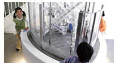
●PR施設「エル・シティ館」

身近に電気やエネルギーのことを知っていただくために、各地にPR施設を設置しています。