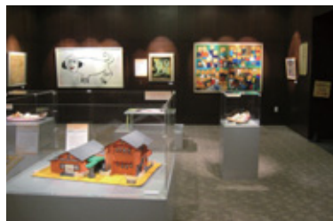
●かんでんコラボ・アート21

2001年から公募展の形で障がいのある方の芸術活動を応援しています。1,000点近くの応募作品の中から厳選された30点の入選作品を9ヶ所で展示しており、作品をご覧いただいた大勢の方からも「元気もらった」などと好評を得ています。