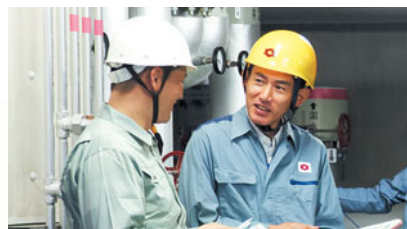
●関西電力によるエネルギー診断

E E C O エネルギー診断により、大規模施設での高効率なエネルギー利用をご提案しています。