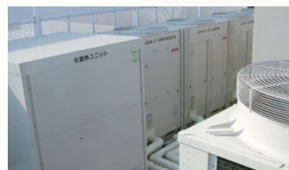
●エコロジーでエコノミーなエコアイス

関西電力は、法人のお客さまに効率のよい上手なエネルギー利用方法として、氷蓄熱式空調システム「エコ・アイス」「エコ・アイスmini」をおすすめしています。このシステムは割安な夜間電力を使って夏は氷水、冬は温水をためておき、昼間の空調に利用するものです。エネルギー効率が高く、ビルなどの大規模な空調設備ですぐれたコストパフォーマンスを発揮しています。