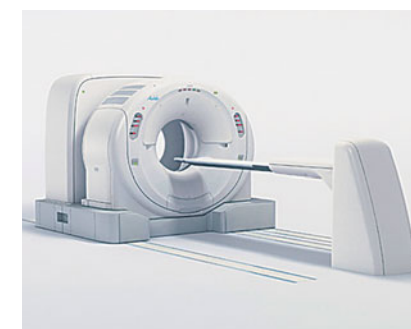
●がんの早期発見に活躍するPET検査装置

関西電力グループでは、蓄積してきたさまざまなノウハウを活かし、より付加価値の高いサービスをご提供しています。会員制健康管理支援サービス、介護付有料老人ホームの運営や在宅介護事業など、グループが一体となって先進の健康・介護サービスをお届けしています。