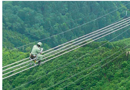
●送電線のメンテナンス

お客さまに電気を安定してお届けする。 そのために関西電力では社員一人ひとりが、一貫した流れの中で仕事に取り組んでいます。長期的な視野で燃料を調達し、効率的に電気をつくること。その電気を無駄なくお客さまにお届けすること。安全を最優先にそれぞれの役割を責任をもって果たし、電力の安定供給に努めています。