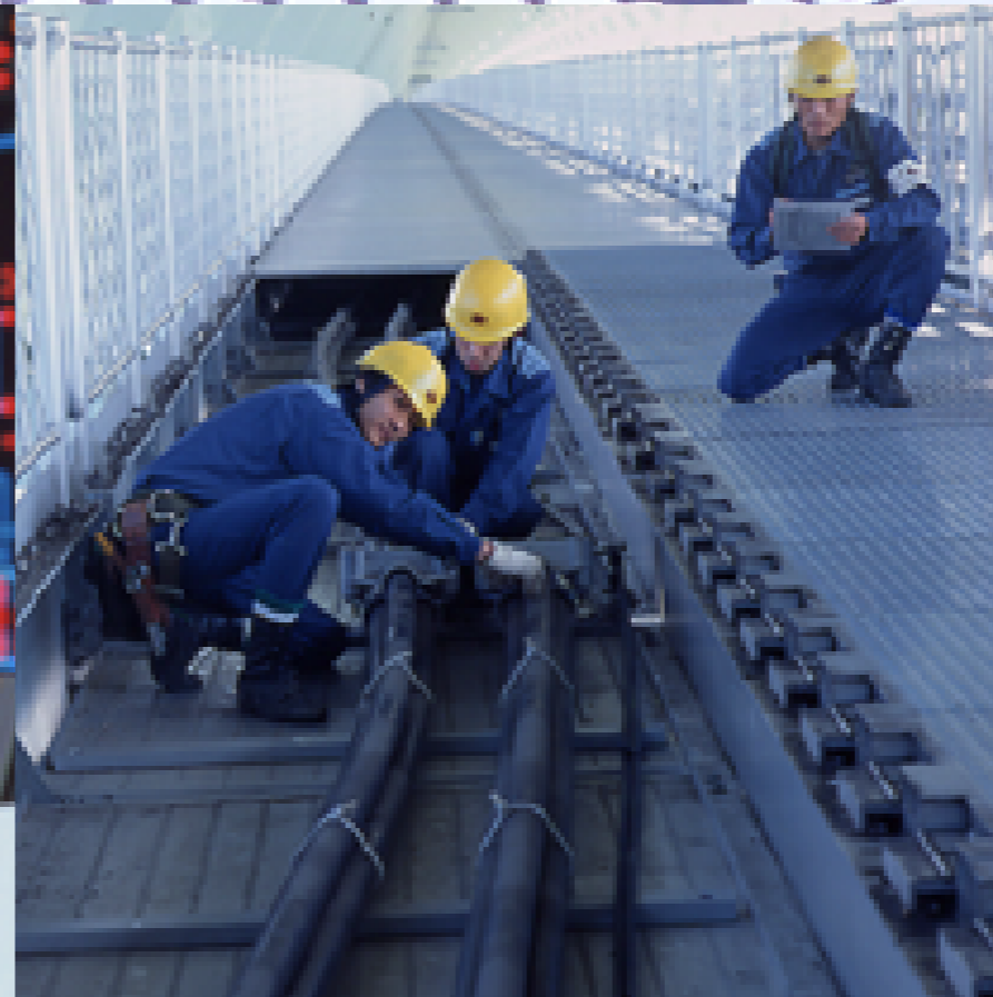
明石海峡大橋のケーブル点検作業

高品質な電気を安定してお届けするため、 発電から販売まで、一貫した事業体制で取り 組むとともに、電源の最適な組み合わせ 「ベストミックス」をすすめています。