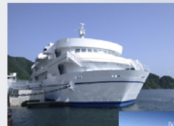
エル・マール まいづる (舞鶴発電所PR館)の全景と館内のプラネタリウム