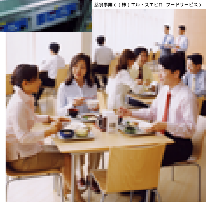
給食事業（（株）エル・スエヒロ フードサービス）