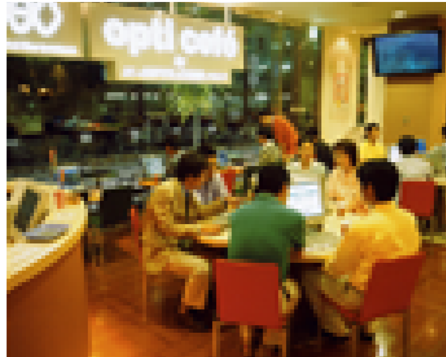
インターネットカフェ・オプティカフェ（（株）ケイ・オプティコム）