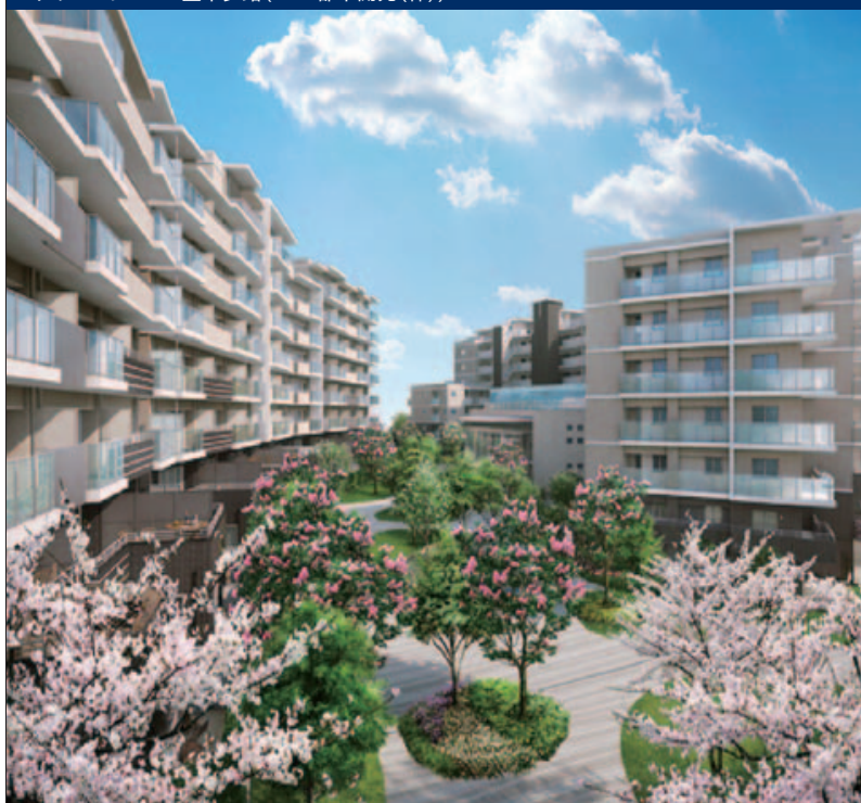
グランロジマン豊中少路(MID都市開発(株))

今後もおお客様の省エネ・省コスト・省CO 2 に貢献する住宅を安定継続的に供給していくため、デベロッパーなどとのネットワークをより一層強化し、複合開発案件や戸建面開発にも取り組んでいきます。