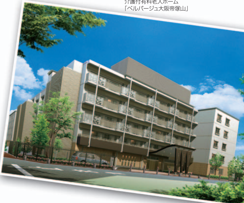
かんてんジョイライフの介護付有料老人ホーム「ベルパージュ大阪塚山」

今後ともお客様の省エネ・省コスト・省CO 2 に貢献する住宅を安定継続的に供給していくため、デベロッパーなどのネットワークをより一層強化し、複合開発案件や戸建開発にも取り組んでいます。