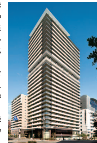
関電不動産の開発物件 「エルグレース神戸三宮 タワーステージ」

今後もオール電化住宅を安定継続的に供給していくため、デベロッパーなどとのネットワークをより一層強化し、複合開発案件や戸建面開発にも積極的に取り組んでいきます。