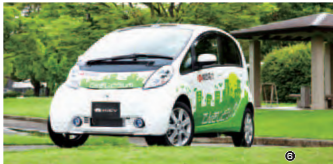
①② ブータン/小規模水力発電プロジェクト ③ 堺市臨海部におけるメガソーラー発電計画 ④⑤ ツバル/太陽光発電プロジェクト ⑥ 電気自動車