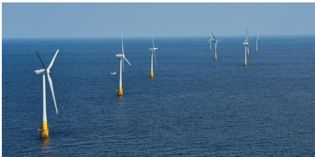
風車 8 基の全景

当 SPC は今後長期にわたる本発電所の運営を通じて、再生可能エネルギーの普及や、地域の方々のより良い暮らしの実現に貢献します。