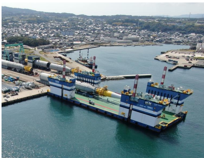
浮体積み込み状況

引き続き、促進区域内における浮体式洋上風力発電所として、2024年1月の商業運転開始を目指し、順次、施工を進めていきます。