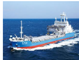
専用船「青栄丸」で青森県むつ小川原港まで海上輸送します。