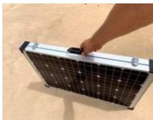
折畳式太陽光パネル