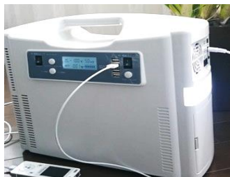
TUMIQUI UNIT (モバイルルータ内臓の蓄電池)