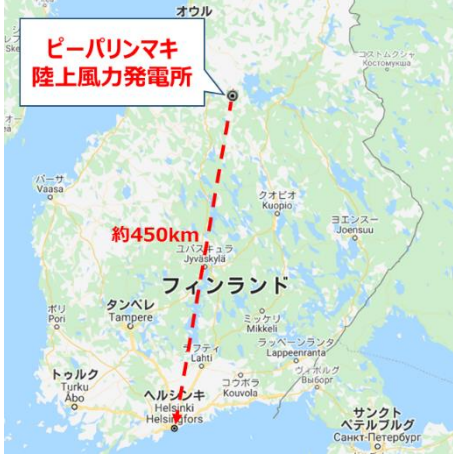
【発電所建設予定地】