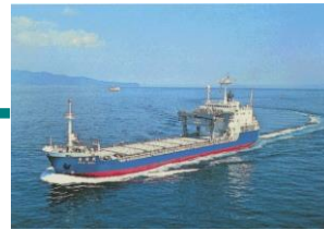
専用船「青栄丸」で青森県むつ小川原港まで海上輸送します。