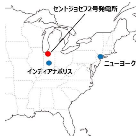
【セントジョセフ2号発電所所在地】