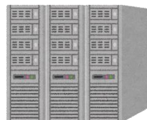
電力ビッグデータ