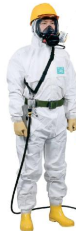
エアラインマスク 着用のイメージ

※原子炉施設内などで放射能汚染した機器や装置の分解・点検・補修などの作業を行うときに、汚染を他の区域に広げないように設置する組立式の部屋