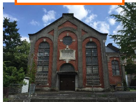
第二期蹴上発電所(背面)