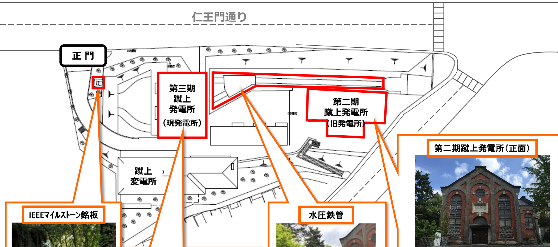
IEEEマイルストーン銘板