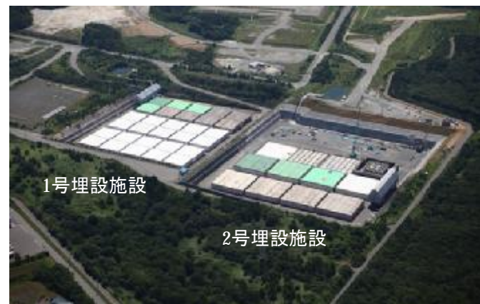
日本原燃（株）六ヶ所低レベル放射性廃棄物埋設センター