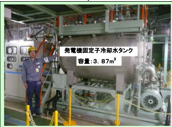
発電機固定子冷却水タンク 容量: 3.87m 3