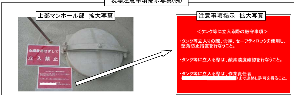
現場注意事項掲示写真(例)