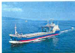
専用船「青栄丸」で青森県むつ小川原港まで海上輸送します。