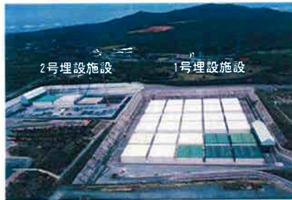
日本原燃 (株) 六ヶ所低レベル放射性廃棄物埋設センター