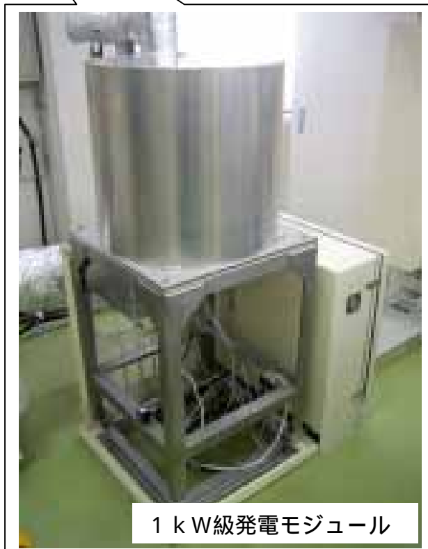
1 kW級発電モジュール