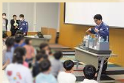
「かんでん家族の日」