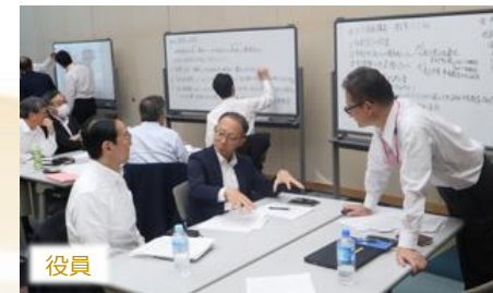
役員 役員向け研修