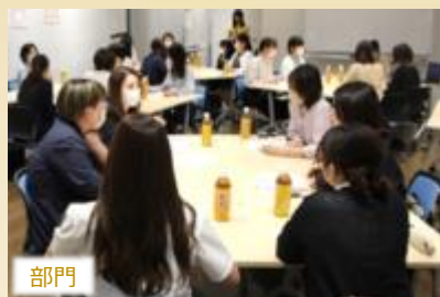
部門 女性社員交流会