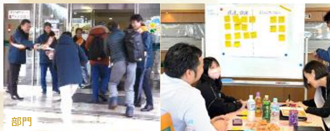
部門 役員 職場改善に向けた取組み