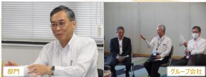
部門 グループ会社 トップによる対話活動