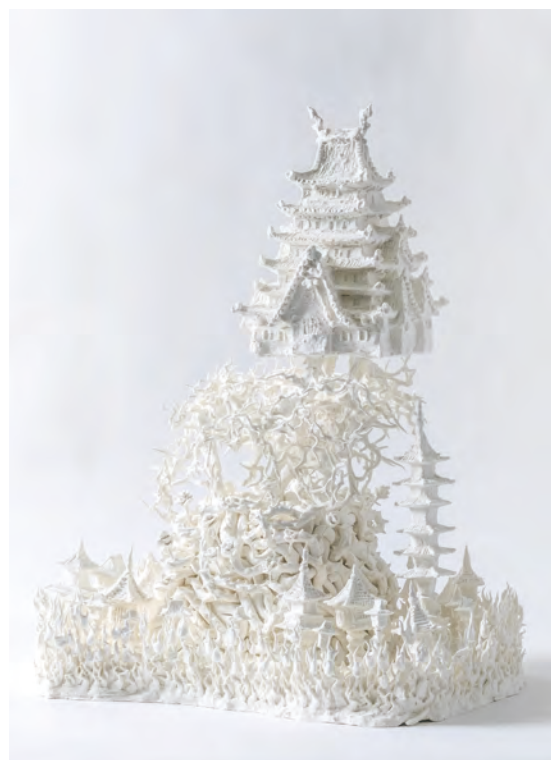
「五現の城」市村 玲央名