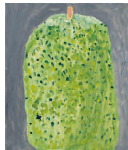
「鎮座する冬瓜」藤本 湊也