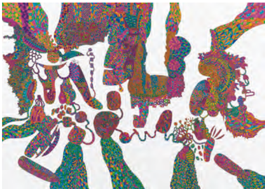
「走馬灯・解体回転木馬」山口 かずなり