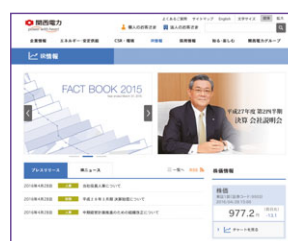
「IR情報」 (当社ホームページ：随時更新)