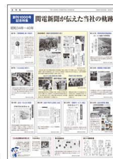
『関西電力新聞 1000号記念号』

し、2016年3月には創刊1000号を迎えました。また、経営計画などについては、社内テレビや社内ポータルサイトを活用して経営層の考えや思いをわかりやすく伝達し、社内コミュニケーションを実践しています。