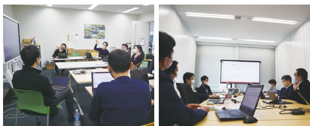
中堅社員による理念検討の様子

この提言を受けて、経営層が、社外取締役やコンプライアンス委員と意見交換をしながら、当社グループの「存在意義」「大切にしている価値観」について議論を重ね、取りまとめました。