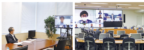
経営層と従業員との意見交換（通称:創生コミ）の様子 （新型コロナウイルス感染拡大防止の観点からリモートで実施）

当社は、新たな経営理念を従業員一人ひとりが真に理解し、日々の業務において実践していくための活動計画を定めており、本計画に基づいて、経営層と従業員との意見交換、各種研修、各職場でのディスカッション、グループ会社支援等の活動を積極的にこなっています。この活動の一環として、「経営理念」、「コンプライアンスチェック」、「安全行動の誓い」を記載した携帯用のコンダクトカードを全従業員に配布しており、従業員は、このカードの裏面に自らの行動宣言を明記し、日々の業務における行動や目標の確認に活用しています。