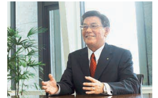
関西電力株式会社 取締役社長

是非ご一読いただき、今後の課題や期待など、忌憚のないご意見を賜りますれば幸いに存じます。