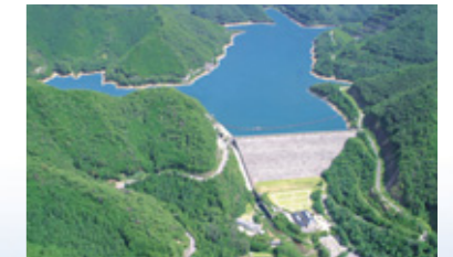
●奥多々良木発電所の多々良木ダム

揚水発電は、余裕のある夜間の電気を利用して上部ダムに水を汲み上げ、電気が多く使われる昼間にその水を使用して発電します。この発電方式は、刻々と変化する電気の需要にあわせて柔軟に対応することができます。さらに、奥多々良木発電所1、2号機では、深夜の電気の需要の変化に対応して揚水電力の調整ができる可変速揚水発電システムの導入を予定しています。これにより今まで以上に安定した電力供給をめざします。