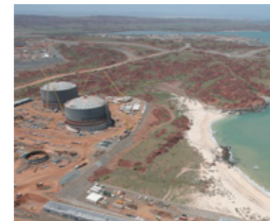
●ブルート建設現場