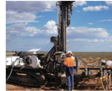
●オーストラリアのウラン鉱山開発現場

原子力発電の燃料には天然ウランを濃縮したウラン燃料を使用します。昨今、新興国を中心としたエネルギー需要の増加による化石燃料価格の高騰や、地球温暖化問題などを背景として、世界的に原子力発電の価値が見直されており、ウラン燃料の争奪戦が始まっています。こうした中、長期的なウラン資源確保のため、関西電力は2006年、カザフスタン共和国のウラン鉱山開発プロジェクトへ参画しました。さらに、2008年から2009年にかけて、関西電力が出資する日豪ウラン資源開発(株)を通じ、オーストラリアにおいてウラン探査プロジェクトや事業化調査に参画するなど、将来にわたる原子燃料の安定調達に努めています。