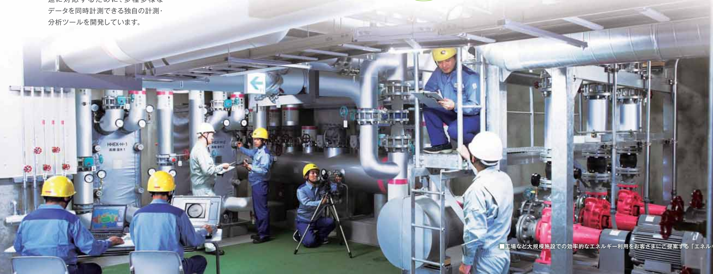
■工場など大規模施設での効率的なエネルギー利用をお客さまにご提案する「エネルギー診断」