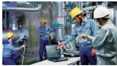
●関西電力によるエネルギー診断

E E C O エネルギー診断で、大規模施設での効率的なエネルギー利用をご提案します。