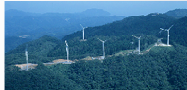
「関西グリーン電力基金」の助成による太鼓山風力発電所(事業主体・京都府)

関西電力は、風力や太陽光発電等の電力購入や、「関西グリーン電力基金」への支援などを通じて、新エネルギーの普及促進を図っています。2003年4月に施行された「RPS法」(「電