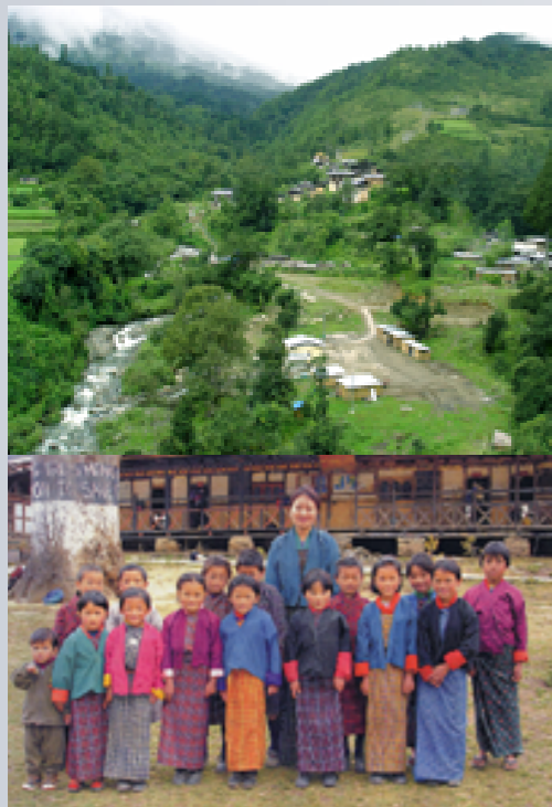
ブータン王国 小規模水力発電所建設プロジェクト

当社がお届けする電力が「エコリーフ環境ラベル」を電力会社で初めて取得しました。これは、製品に関する定量的な環境負荷データについて第三者による認証を受け、開示するものです。