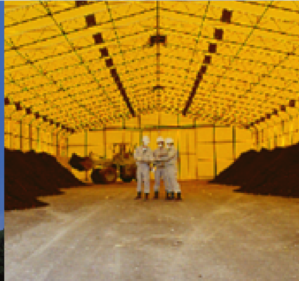
汚染土壌の浄化 (関電ジオレ (株))

CO 2 の排出量の削減による地球温暖化の抑制や、循環型社会を実現するための様々な取り組みを通じて、地球環境の保全に取り組んでまいります。