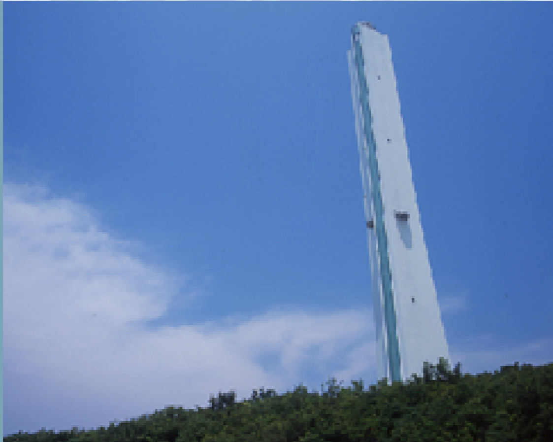
南港発電所 (ISO14001外部認証を取得)