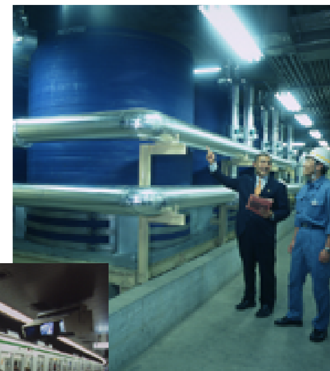
エコ・アイス (蓄熱式空調システム)