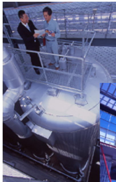
エコ・アイス（蓄熱式空調システム）