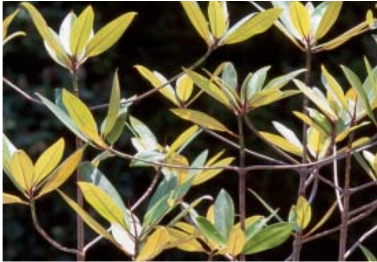
マングローブに関する研究 (総合技術研究所)

CO 2 の排出削減による地球温暖化の抑制、ISOの国際規格に適合した環境管理システムの構築、さらに、循環型社会を実現するための様々な取り組みを通じて、地球環境の保全に取り組んでまいります。