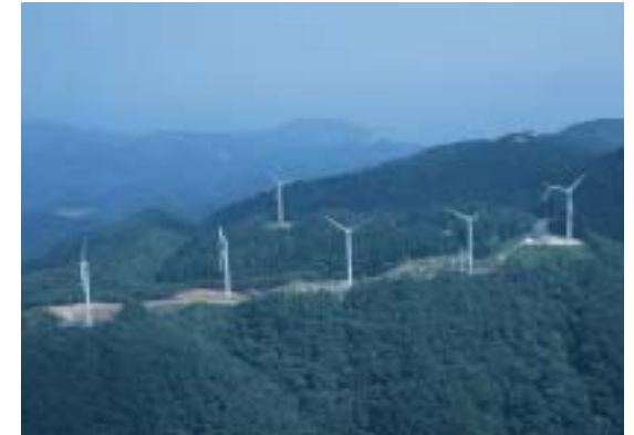
「関西グリーン電力基金」の助成による太鼓山風力発電所(事業主体・京都府)