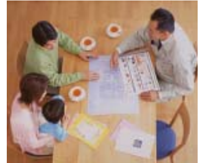
電化リフォーム（かんでんEハウス）