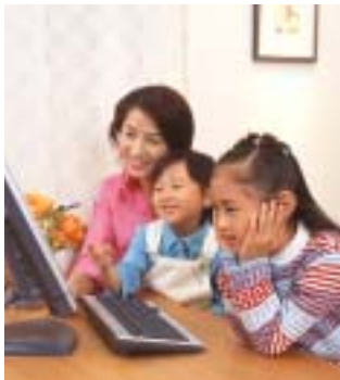
インターネット(ケイ・オブティコム)