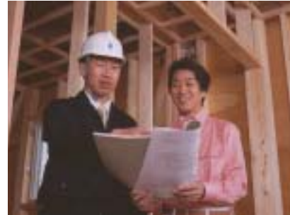
住宅性能評価・表示サービス（関西住宅品質保証）