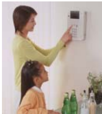
ホームセキュリティ（関電SOS）