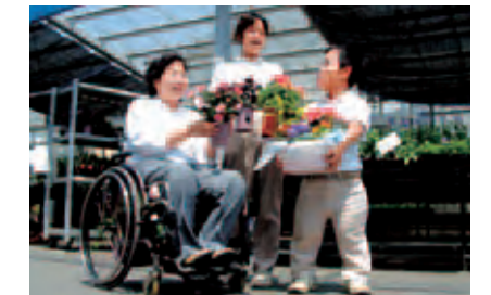
無限の可能性を拓く～かんでんエルハート～