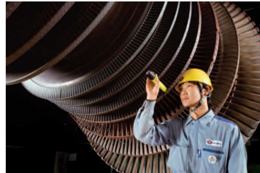
発電所のタービン点検作業

当社は、こうした電気事業固有の高度な専門技術・技能の維持・継承を図るとともに、従業員がやる気・やりがいをもち業務に従事できるような環境を整備することを目的に「専門技術・技能者」制度を導入するなど、制度や体制の充実に力を注いでいます。