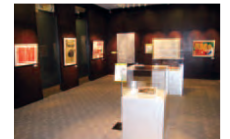
障がい者アート公募展「かんでんコラボ・アート21」